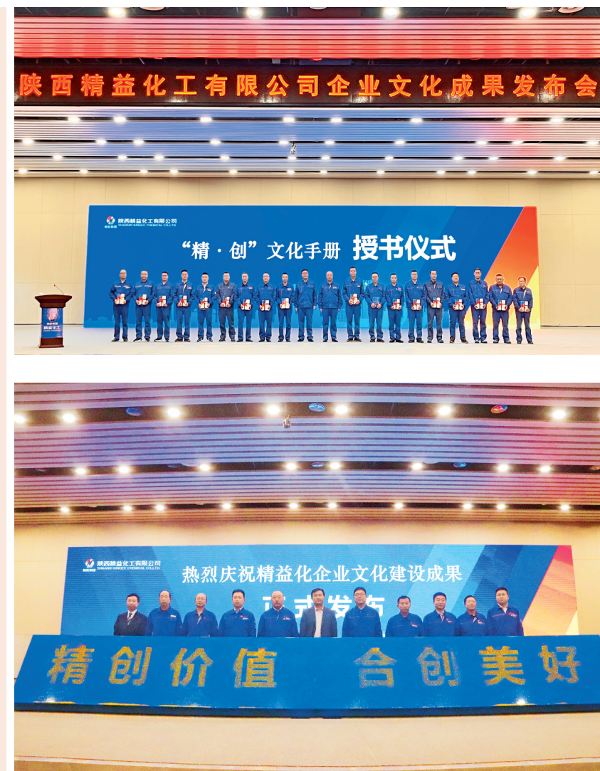
陕西精益化工有限公司企业文化成果发布会